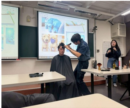
114年12月3日 複合式理髮咖啡 廳 x 夫妻的創業之路