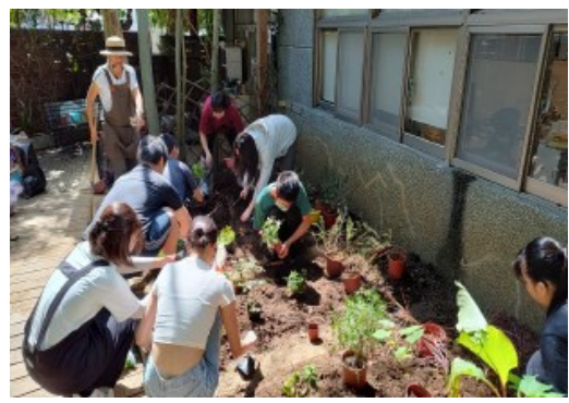
園藝種植 與自然接觸的療癒