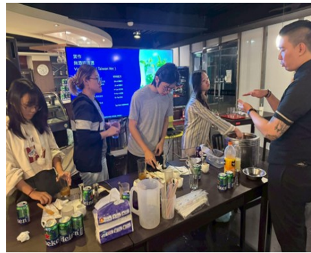
114年12月8日 要不要跟我出去酒一酒-手作體驗