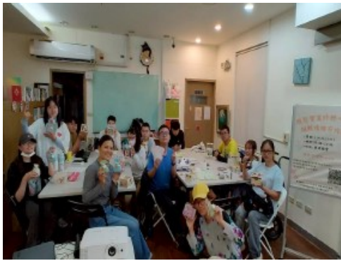
做自己的舒壓寶盒