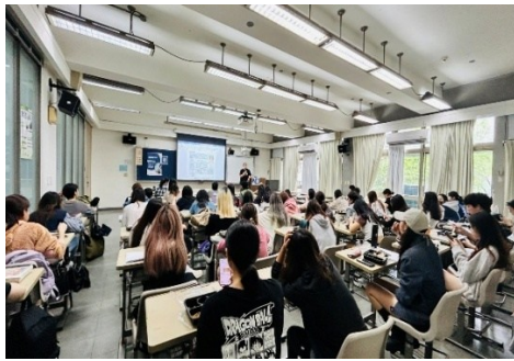
114年10月22日 履歷面試指導