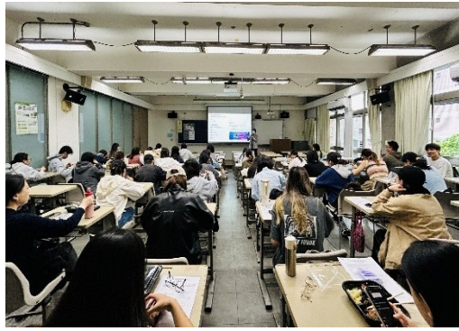
114年5月7日 打造人生勝利履歷、面試必勝攻略