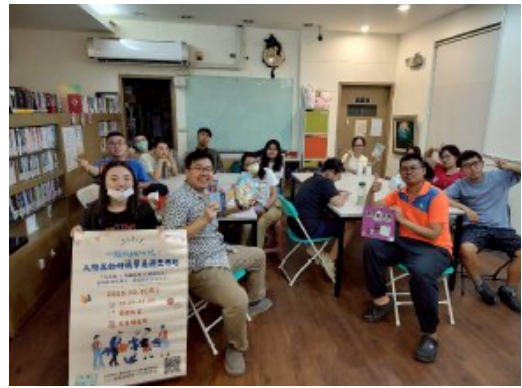
桌遊好簡單 人際互動工作坊