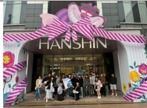
114年11月27日 校外參訪 漢神巨蛋-商家陳列與擺設