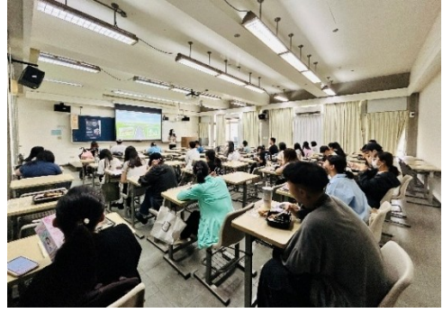
114年10月8日 職涯 GPS 開啟中~ 用 UCAN 導航你的未來職場地圖